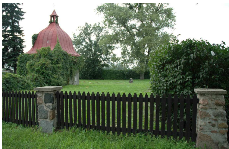
Fot. 81. Cmentarz wojenny z I Wojny Światowej – Bolimowska Wieś