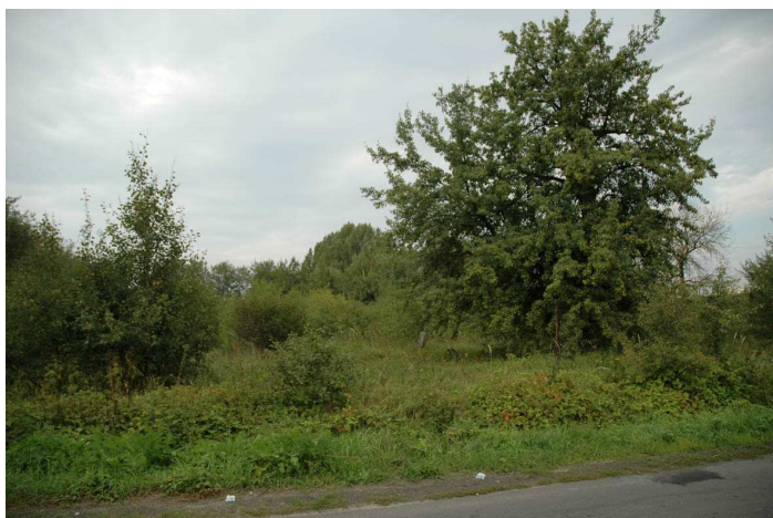
Fot.92. Cmentarz żydowski - Wiskitki