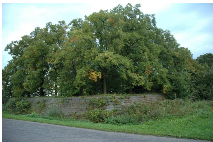
Fot.83. Cmentarz wojenny żołnierzy niemieckich - Humin