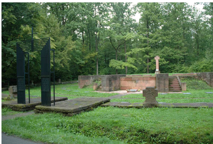
Fot.86. Cmentarz wojenny żołnierzy z I i II Wojny Światowej – Joachimów-Mogiły