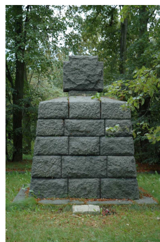
Fot.84. Cmentarz wojenny żołnierzy niemieckich - Humin