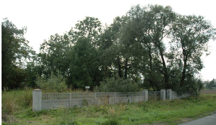
Fot.94. Cmentarz wojenny z I Wojny Światowej (żołnierzy radzieckich) - Wiskitki