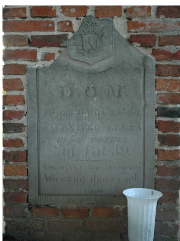
Fot.89. Cmentarz grzebalny – Kurzeszyn (tablica w słupie bramy Walenty Lenke)