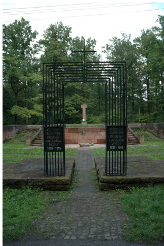
Fot.85. Cmentarz wojenny żołnierzy z I i II Wojny Światowej – Joachimów-Mogiły