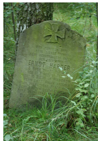
Fot.88. Cmentarz wojenny żołnierzy niemieckich z I Wojny Światowej – Wólka Łasicka (zachowany nagrobek gen. Ernesta Hardera)