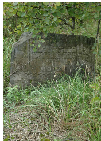
Fot.93. Cmentarz żydowski - Wiskitki