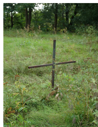
Fot.95. Cmentarz wojenny z I Wojny Światowej - Wiskitki