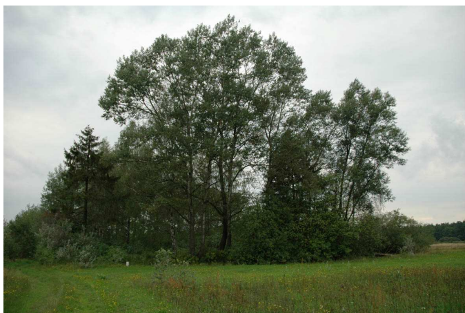
Fot. 87. Cmentarz wojenny żołnierzy niemieckich z I Wojny Światowej – Wólka Łasiecka