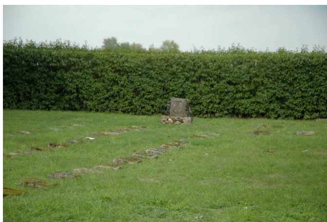
Fot. 82. Cmentarz wojenny z I Wojny Światowej – Bolimowska Wieś